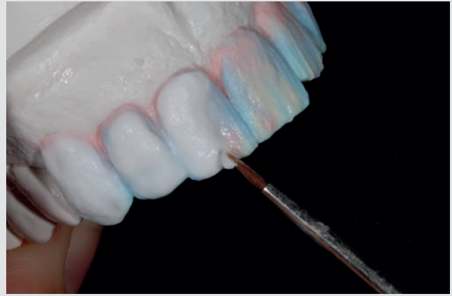
Viele einzelne Schichten sind erforderlich, um Ihrem neuen Zahn natürliche Ästhetik zu verleihen

Liebe Leserinnen und Leser, wenn Sie sich mit Zahnersatz beschäftigen (müssen), dann nehmen Sie sich Zeit für eine ausführliche Beratung. Zahnersatz soll viele Jahre „funktionieren“ und Ihnen ein sympathisches Lächeln schenken. Beide Ziele zu erreichen, ist nur einem eingespielten Team vor Ort möglich, dem Sie vertrauen.