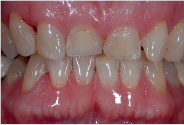
Leider keine Ausnahme: Ästhetisch mangelhafte obere Frontzähne

Und ständig wird weiter an attraktiven Lösungen gearbeitet. So bietet der Zahntechnik-Spezialist Kimmel in Koblenz neben vielen anderen Optionen auch Zirkonoxid-Kronen an, die im sichtbaren Bereich durch den Auftrag von Verblendkeramiken ästhetisch perfektioniert werden. Das bietet einerseits den Vorteil hochfunktioneller und hochfester Kauflächen und andererseits eine Ästhetik, die vom natürlichen Zahn praktisch nicht mehr zu unterscheiden ist. Diese anspruchsvollen Arbeiten sind das Ergebnis einer engen Zusammenarbeit von Zahnarzt und Zahntechnik. Deshalb arbeiten engagierte Zahnärzte in der Region gerne mit Kimmel Zahntechnik zusammen. Und so entsteht – unter Mitwirkung des Patienten – Zahnersatz in Form von Kronen und Brücken, der sich exakt an der vorher abgestimmten Form orientiert. Erleichtert wird dies dadurch, dass vor der endgültigen Fertigung ein Modell in Kunststoff hergestellt wird, an dem der Patient sehen kann, wie seine individuell gefertigten Kronen aussehen und an dem er seine Wünsche verdeutlichen kann. Zahlreiche Arbeiten zeigen, dass die Zufriedenheit der Patienten mit dieser Vorgehensweise sehr hoch ist.