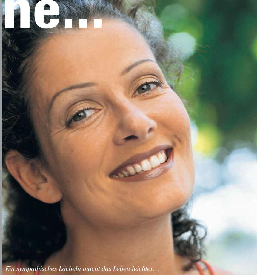
Ein sympathisches Lächeln macht das Leben leichter...

Dieser Satz ist in unserem Sprachgebrauch eigentlich die Aufforderung sich durchzusetzen, Stärke zu beweisen. Zähne zeigen – das kann aber durchaus auch wörtlich gemeint sein. Denn Sympathie gewinnt man mit einem offenen Gesichtsausdruck. Wie gewinnend ein schönes Lächeln ist, kann jeder von uns in seinem persönlichen Umfeld beobachten. Gleichmäßige Zahnreihen und schöne, helle Zähne prägen den ersten Eindruck eines Menschen – in den berühmten ersten und entscheidenden Sekunden des Kennenlernens.