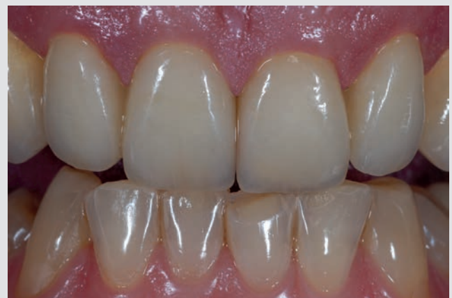
Und so natürlich können auch Ihre neuen Zähne dann aussehen