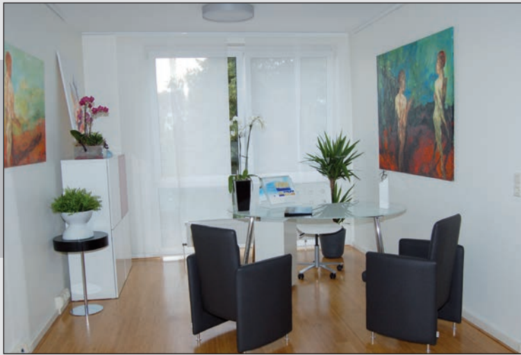
Stilvolles Ambiente für eine individuelle Beratung