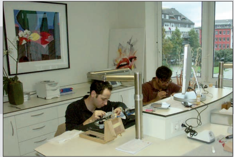
Kreativer Raum für einzigartige zahntechnische Meisterwerke mit einzigartiger Ästhetik und Funktionalität

Dreifachfunktion: Hier können sich die Besucher für die zahntechnische Beratung bei uns, aber auch beim Institut „Cranium 3D Kopf Diagnostik“ anmelden. In dieser Kooperation für den bestmöglichen Service am Patienten, leben wir auf 170 qm auch den Forumsgedanken: Zahntechnische Implantatplanung in Verbindung mit spezialisierter radiologischer Dienstleistung per Digitalen Volumen Tomographen (DVT) für zahnmedizinische Diagnostik. Beide Termine können in Abstimmung mit dem behandelnden Zahnarzt so koordiniert werden, dass der Patient die berühmten zwei Fliegen mit einer Klappe schlägt! Unseren großen Empfangsbereich nutzen wir aber auch ganz pragmatisch – schnell mit Stühlen bestückt – für Fortbildungs- und Patienteninformationsveranstaltungen.“