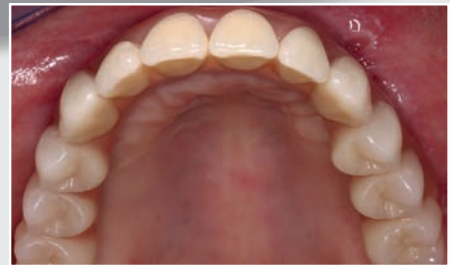
...eine herausnehmbare Teleskopprothese mit Kunststoffzähnen.