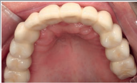
Drei eindrucksvolle Beispiele für preiswerten Zahnersatz made in Koblenz: Eine feste Brücke, SympaDent® Metallkeramik bemalt...

Testen Sie uns! Fragen Sie nach den aktuellen Produkt- angeboten Gültig bis zum 30.06.2013