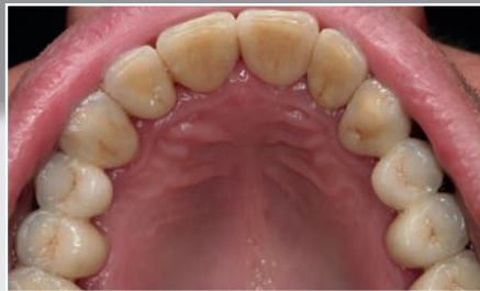
...eine feste Brücke aus Vollkeramik, individuell keramisch verblendet und...